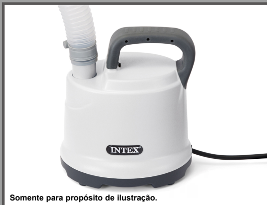
Somente para propósito de ilustração.

BOMBA DE DRENAGEM Modelo DP30220 220 - 240V~, 50Hz, 99W Hmax 2.5 m, Hmin 0.01 m, IPX8