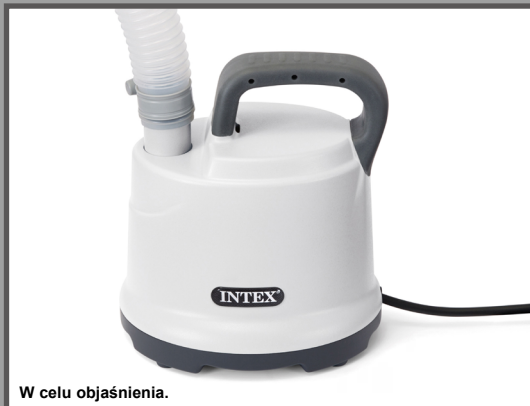
W celu objaśnienia.

POMPA ODSYSAJĄCA Model DP30220 220 - 240V~, 50Hz, 99W Hmax 2.5 m, Hmin 0.01 m, IPX8