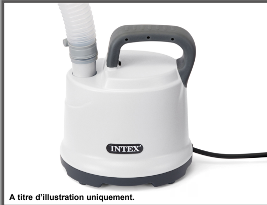
A titre d'illustration uniquement.

POMPE D'EVACUATION POUR EAU CHARGÉE Modèle DP30220 220 - 240V~, 50Hz, 99W Hmax 2.5 m, Hmin 0.01 m, IPX8